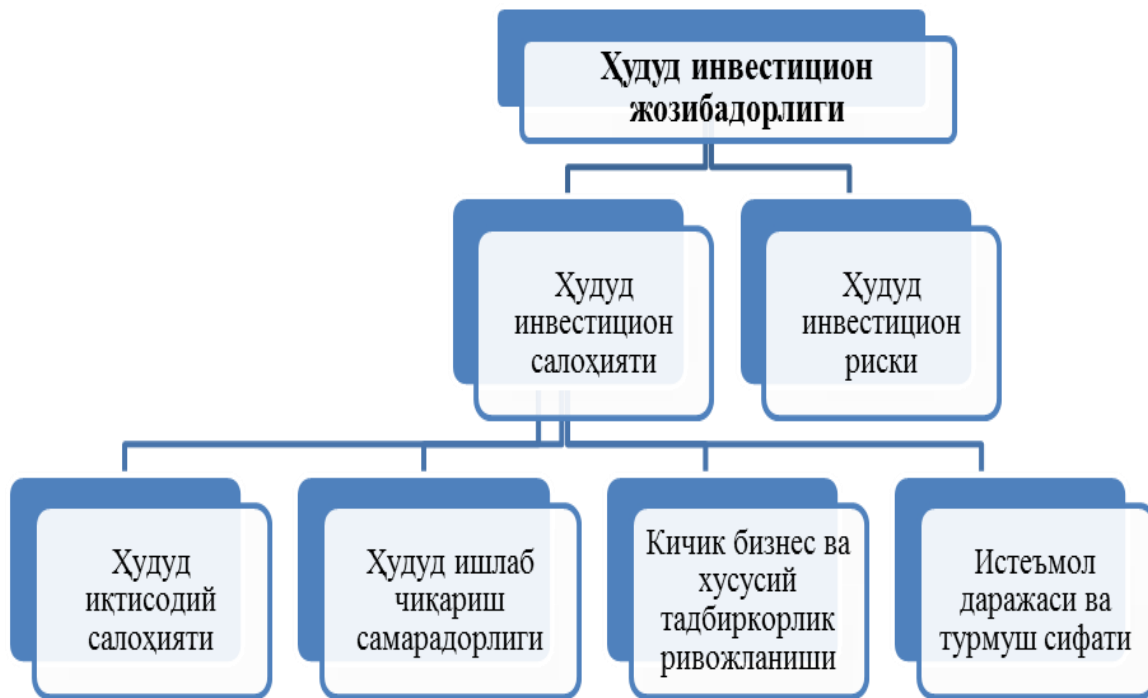
1-расм. Ҳудуд инвестицион жозибadorлиги кўрсаткичлари таркиби 95

Муаммони ҳал қилиш усуллари. Мамлакат ҳудудлари инвестицион жозибadorлигини аниқлаш борасида мавжуд ёндашувлар ва методикаларни тадқиқ этиш натижасида ўзига хос методика шакллантирилди. Унга кўра, ҳудуд инвестицион жозибadorлигига таъсир кўрсатувчи омиллар (кўрсаткичлар) гуруҳларининг умумлашган ҳолдаги таснифи ишлаб чиқилди (1-расм). Ҳудуд инвестицион жозибadorлигини баҳолашнинг ушбу кўрсаткичлар тизими барча соҳаларни қамраб олади ва унда инвестиция киритиш натижасининг турли томонлари ҳамда инвесторларнинг турли ҳошиш-истаклари (қизиқишлари) инobatга олинган.