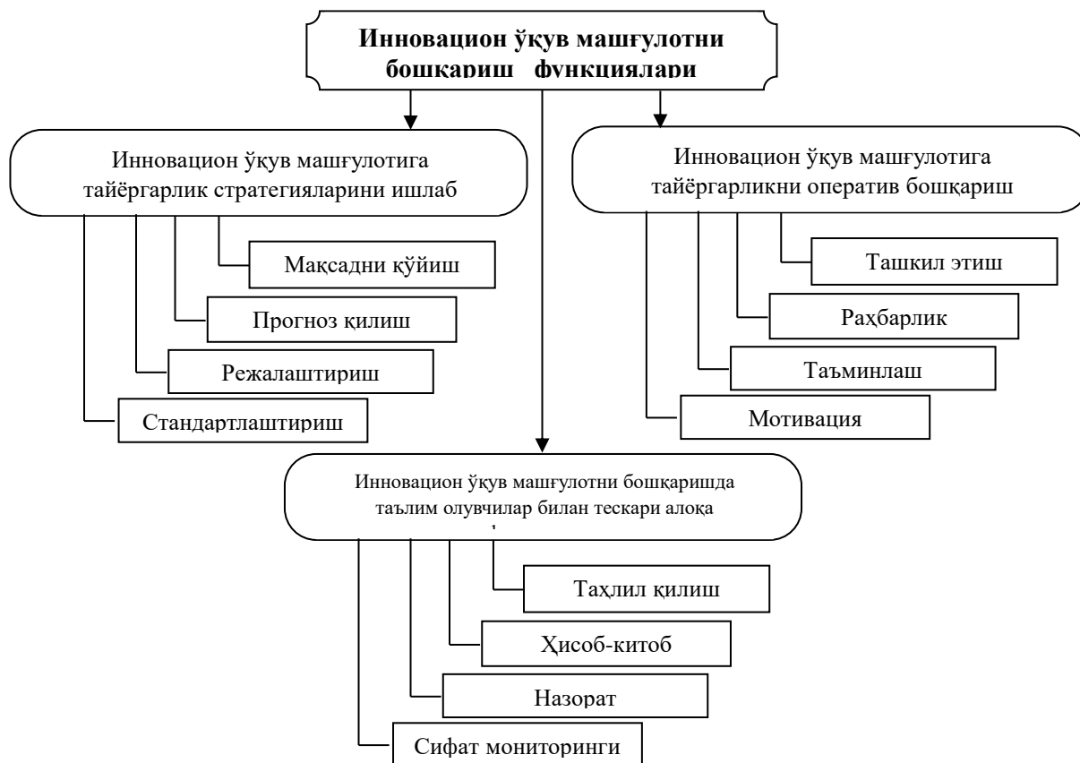
1-расм. Иновацион ўқув машғулотини бошқариш функциялари модели

Замонавий ижтимоий-иқтисодий шарт-шароитларда таълим тизимига бўлаётган муносабат, таълим муассасаларида яратилаётган қулайликлар, улардаги моддий-техник ва илмий-услубий таъминотнинг ривожланиши йўлида қилинаётган барча ижобий ишлар улар ривожига қаратилган бўлиб, бу ўз навбатида ўқув машғулотни бошқарувини замонавий ёндашувлар асосида такомиллаштириш заруриятини туғдиради.