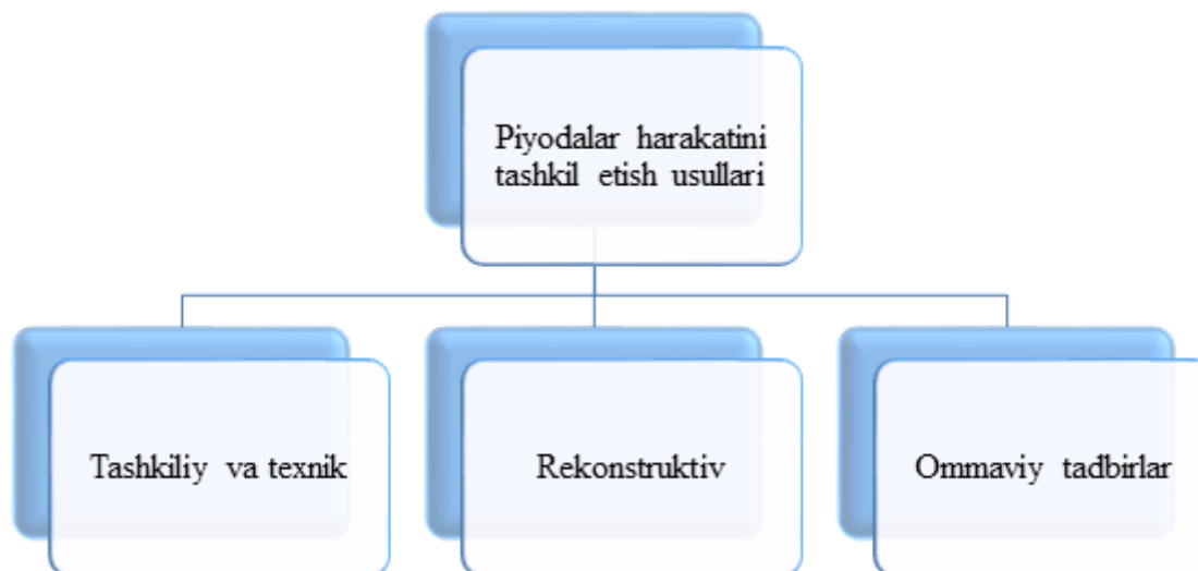
3-rasm. Piyodalar harakatini tashkil etish usullari

Piyodalar harakatini tashkil etishning bir necha guruhga ajratish mumkin (1-rasm) :